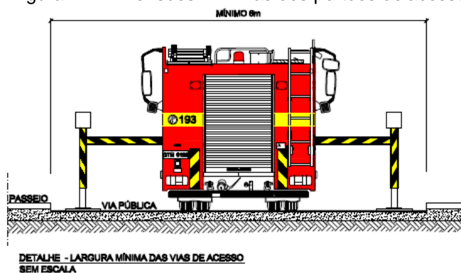
Figura 2 – Dimensões mínimas dos portões de acesso

5.1.2.1 Os portões de acesso devem possuir largura mínima de 4 (quatro) m e altura mínima de 4,5 m.