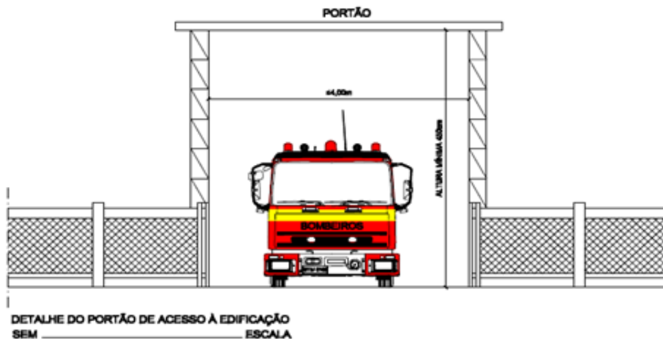
Figura 2 – Dimensões mínimas dos portões de acesso