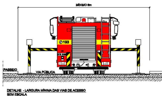
Figura 1 – Largura mínima de vias de acesso

5.1.3.6 É recomendável que todas as edificações com altura superior a 6,0 metros a serem construídas possuam um afastamento de via pública ou de via de acesso inferior a 10 metros, a fim de possibilitar a utilização da viatura Auto Escada no auxílio de ações de salvamento e no combate a incêndio.